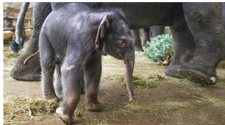
L'éléphanteau du zoo de Berlin a été nommé Edgar. C'est un éléphant d'Asie. Sa maman, Kewa (32 ans), a déjà eu 5 autres petits.

Gestation. « Dans ces conditions, une femelle éléphant peut difficilement avoir plus de 6 petits dans sa vie, car sa gestation dure près de 2 ans (environ 22 mois). Puis, l'éléphanteau a besoin de 1 an pour être sevré et il reste