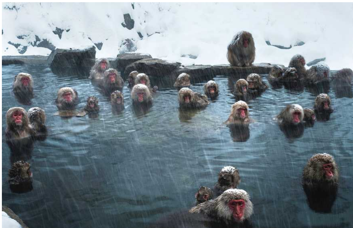
Ces macaques japonais se baignaient dans un bassin d'eau chaude, lundi, alors qu'il neigeait sur leur zoo, à Yamanouchi, au Japon (Asie).

{ Le mot anglais du jour } avec MY WEEKLY : hive